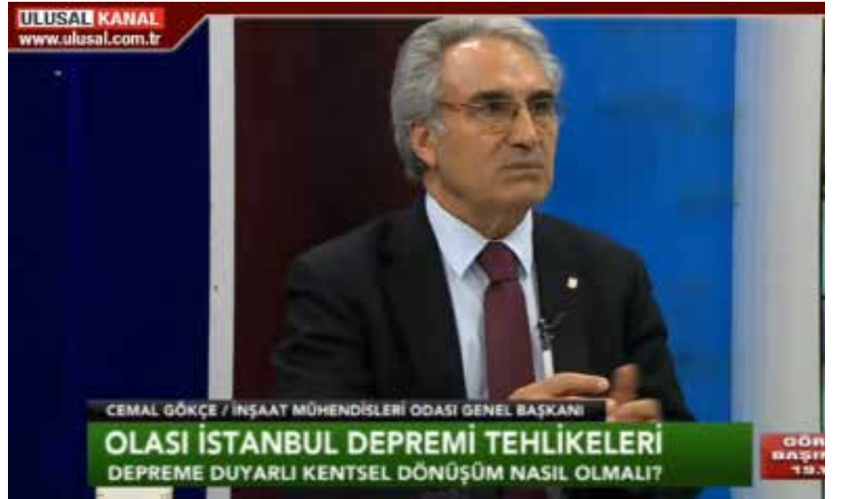
*Türkiye`de ve İstanbul`da Yapı Stokunun Durumu, Deprem, İmar Barışı ve Yeşilyurt Apartmanı.. İlgili, KRT Kanalına Değerlendirmelerde bulundu (13 Şubat 2019)