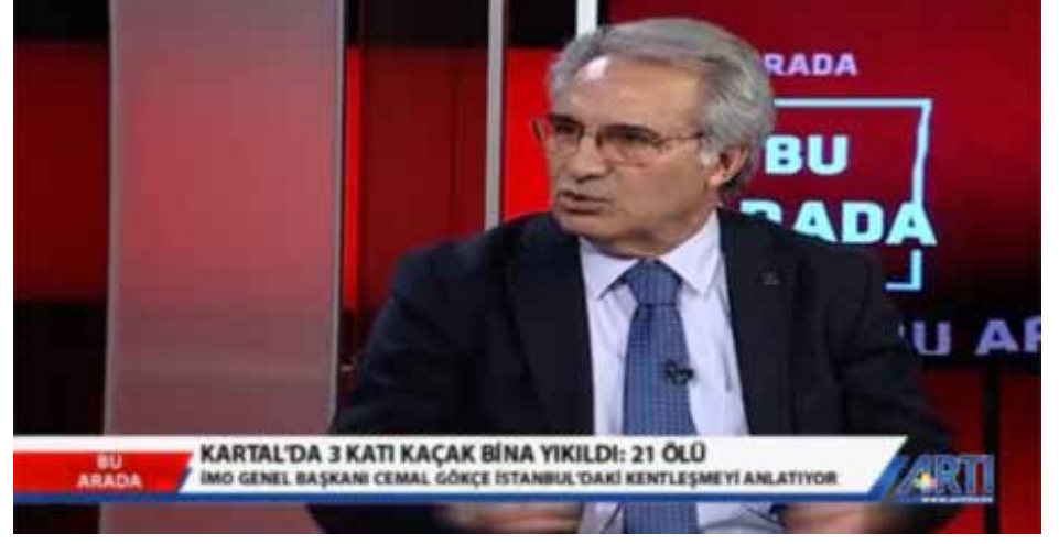
*TMMOB İnşaat Mühendisleri Odası Başkanı Cemal Gökçe'nin İstanbul-Kartal'da Çöken Binayla İlgili, Artı 1 Kanalına Yaptığı Açıklama (8 Şubat 2019)